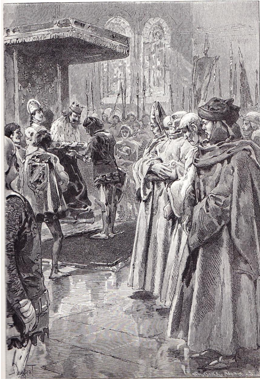
BERTRAND FAIT CONNÉTABLE (CHAP. XLVIII)